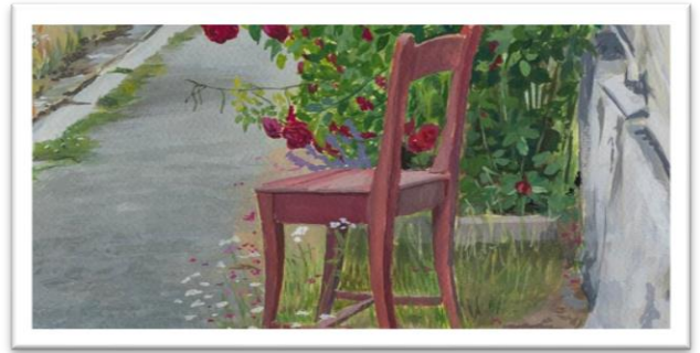
Ote Marika Minkkisen maalauksesta