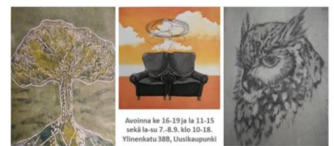
Avoimna ke 16-19 ja la 11-15 sekä la-su 7.-8.9. klo 10-18. Ylinenkatu 38B, Uusikaupunki