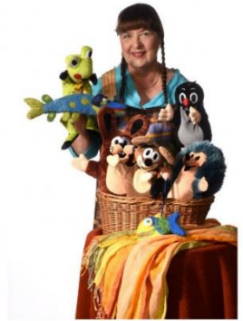
JUHLAN AIKA Nukketeatteri Piironginlaatikon 35-vuotisnäyttely