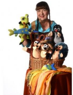
JUHLAN AIKA Nukketeatteri Piironginlaatikon 35-vuotisnäyttely